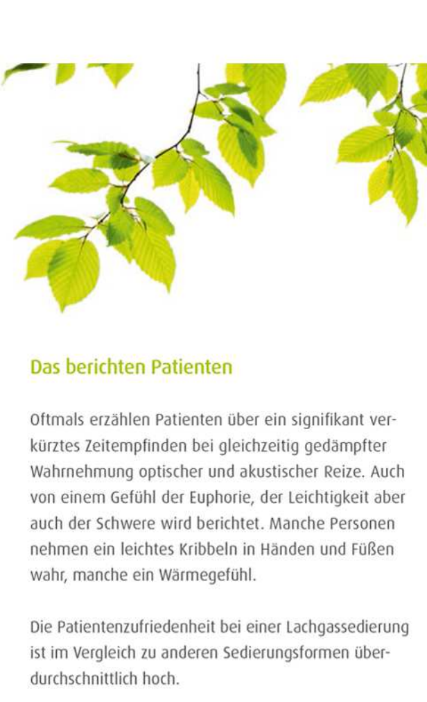
Eine Zahnbehandlung kann auch angstfrei und gelassen ablaufen