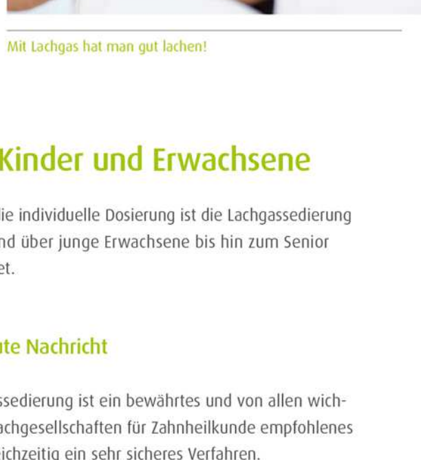
Mit Lachgas hat man gut lachen!

Die Patientenzufriedenheit bei einer Lachgassedierung ist im Vergleich zu anderen Sedierungsformen überdurchschnittlich hoch.