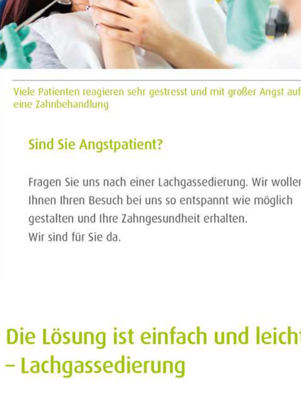
Viele Patienten reagieren sehr gestresst und mit großer Angst auf eine Zahnbehandlung

Unter dem Namen Lachgas bekannt, ist Stickoxydul ein nicht allergenes, nicht reizendes Gas, welches das zentrale Nervensystem beeinflusst. Die schmerzstillende und beruhigende Wirkung wurde bereits im 19. Jahrhundert entdeckt und bis heute millionenfach angewandt.